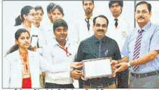
सुभारती डेंटल कॉलेज में मेधावियों को सम्मानित भी किया गया। • हिन्दुस्तान